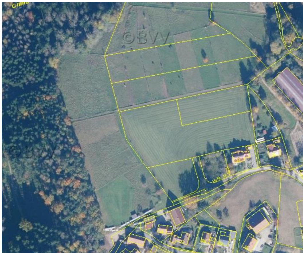
Luftbildkarte des Geltungsbereichs

Das Baugebiet liegt an exponierter Stelle mit ausgeprägter Blickbeziehung zur Kirche „Am Bühl“.